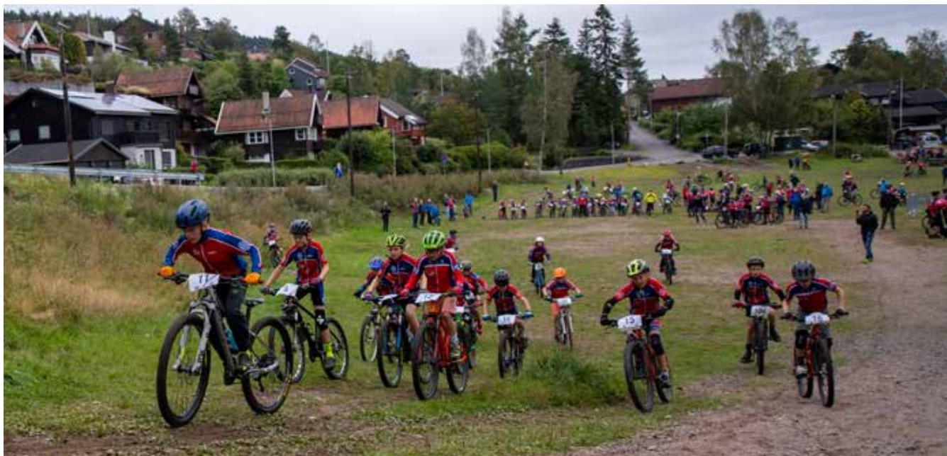
Fra klubbmesterskapet i terreng.

Landeveisgruppa har ved et par tilfeller hatt sosialt opplegg utenfor treningstilbudet og vil kommende sesong ta sikte på tilbud om helgesamling for satsningsgruppas medlemmer. Rye BU, hvor alle grener dekkes har mål om å få til en felles samling i 2020.