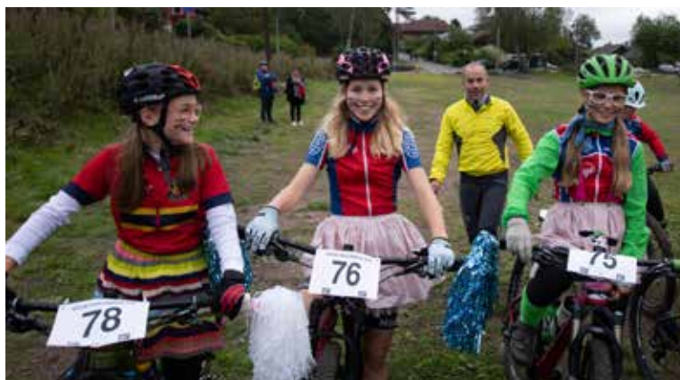
Fra klubbmesterskapet i terreng.

I september ble det arrangert klubbmesterskap landevei med god deltagelse fra satsningsgruppen, yngste landeveisgruppe og terrenggruppen. Konkurransen gikk som fellesstart opp til Grefsenkollen. Det ble kåret syv klubbmestere i en rekke klasser fra 11-årsklassen til juniorgruppen. Klubbmesterskapet ble avsluttet med sosialt program på Langsetløkka.