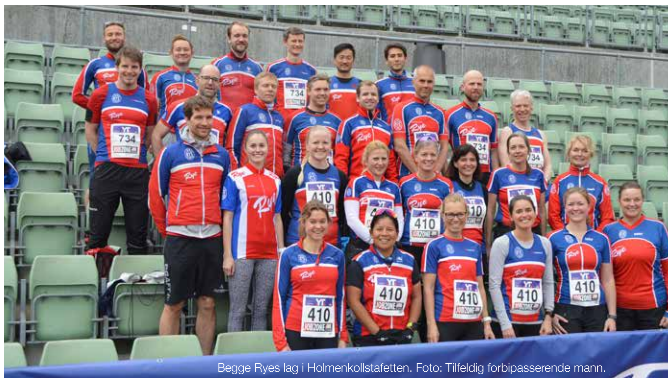
Begge Ryes lag i Holmenkollstafetten.

HK-stafetten 11. mai: Rye stilte med fullt dame- og herre-lag i seniorklassen, etter intenst rekrutteringsarbeid. Herrelagets sluttid ble 1.07.57, mens damelaget kom inn på 1.24.33, tidene er hhv 4.03 og 5.23 mer enn i fjor.