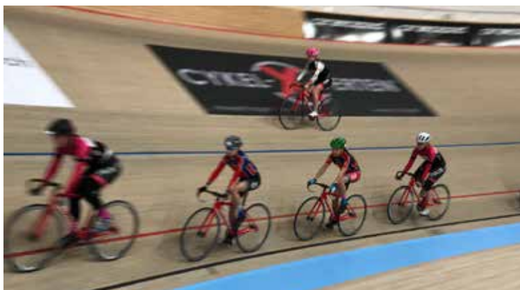
Jentebanesamling i Odense

Gruppen har hatt flere treninger hvor syklister fra andre sykkelgrener i Rye har hospitert.