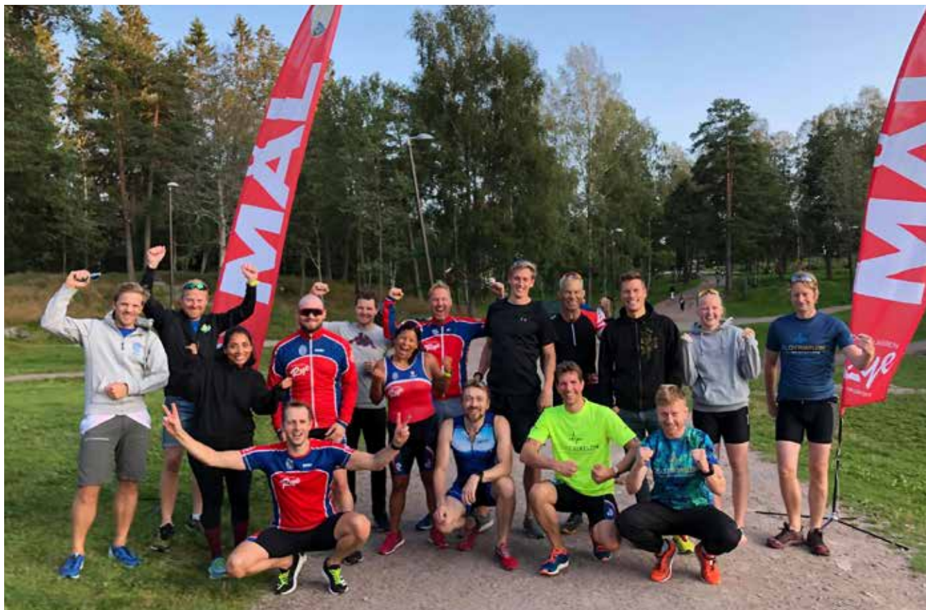
Klubbmesterskap 21. august.